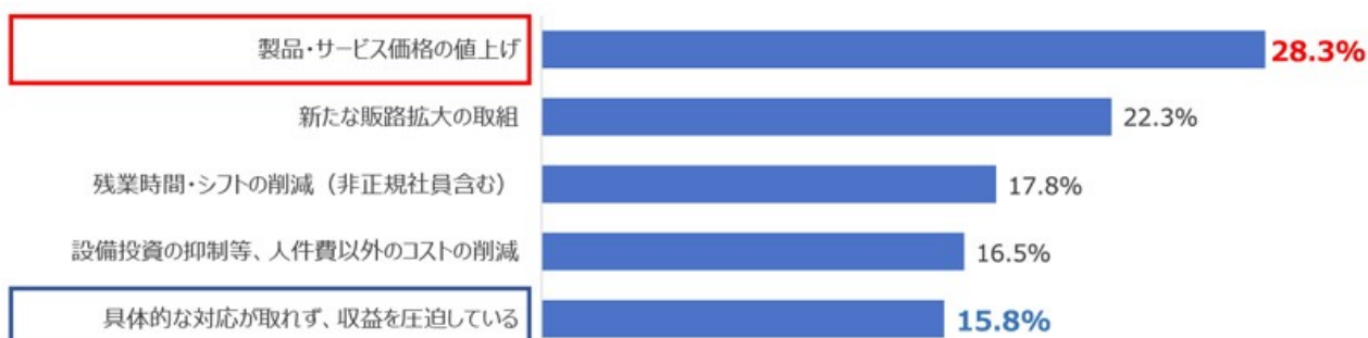
最低賃金引上げにともなう人件費の増加への具体的な対応

今年度の改定については、「引き下げるべき」または「引き上げずに維持すべき」と回答した企業は 33.7%でした。「引き上げるべき」と回答した企業は 42.4%で、引上げ幅を尋ねたところ最も多かったのは「2～3%（19～29円程度）以内」でした。日商は、「賃上げが苦しい状況ではあるものの、コロナ禍の緩和で厳しい人手不足が戻り、上げざるを得ないと考えている企業もあるようだ」と話しています。